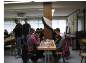
Mk 3.,4.,5. Mannschaft 22.04.2012_014.jpg