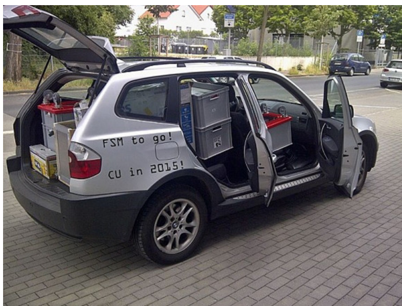
Das FSM-Mobil ist bereit