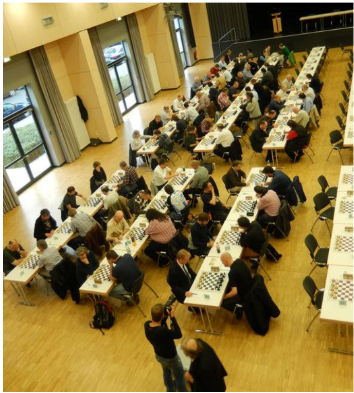
Optimale Spielbedingungen und durchaus Platz für mehr!

Anders als im letzten Jahr bin ich diesmal nicht der einzige, der schon vorher weiß, dass wir es mit sehr annehmbaren Turnierbedingungen zu tun haben: über 150 Teilnehmer können nun ihrerseits entscheiden, ob es sich wieder lohnt nach Höchst zu kommen, oder noch besser, auch anderen von dem Turnier zu erzählen. Warum sollten wir nicht gleich mal schon beim zweiten Auftreten in Höchst die 179-Teilnehmer-Marke in Angriff nehmen. Und vor der 200 ist mir persönlich auch nicht bange. :-)